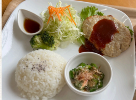
手作りハンバーグディッシュ