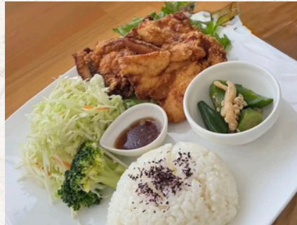
鶏からディッシュ