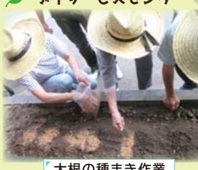
大根の種まき作業