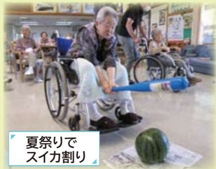
夏祭りでスイカ割り