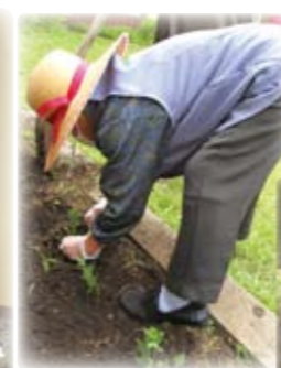
なす、きゅうり、トマト、スイカ、じゃがいも、メロン、菊、枝豆等の苗を植えました。