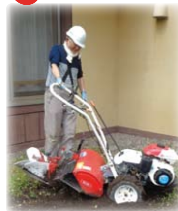
地域のボランティアさんに土を耕して頂きました。