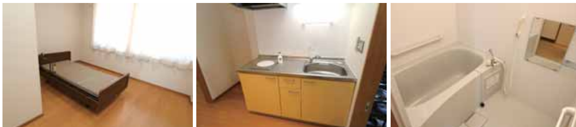
(『特別養護老人ホームサン・グリーンゆざわサテライト型特別養護老人ホーム「桜おかだ」』の部屋の様子)