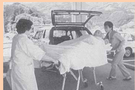
(愛光園での『入浴サービス』)