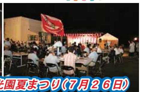
愛光園夏まつり(7月26日)