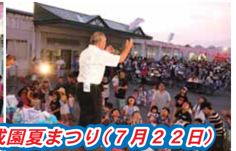
平成園夏まつり(7月22日)