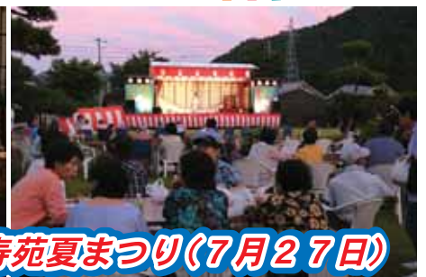
幸寿苑夏まつり(7月27日)