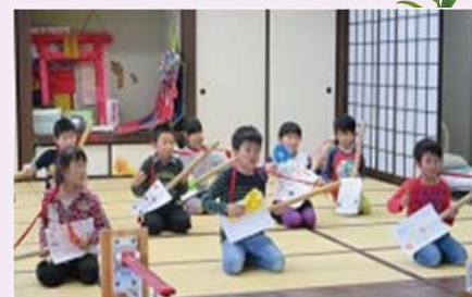
東成瀬小学校 学童クラブ 様