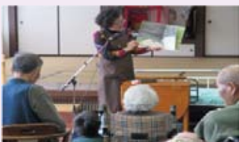
読みかたりグループ「つくしんぼ」様