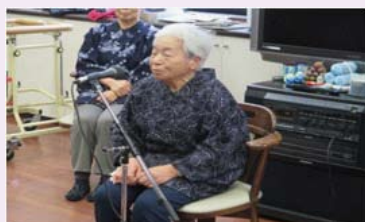
東成瀬昔っこの会 様