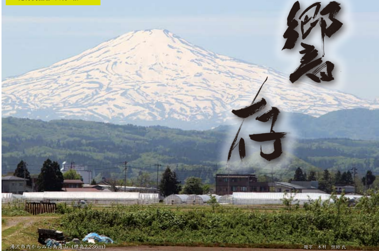
湯沢市内からみた鳥海山（標高2,236m）