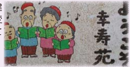
たまごアートでお出迎え

当ホームの特色は淡黄色に統一され、松とつつじの植木を中庭に自然と調和し、内部は高い天井と木目を生かした明るく落ち着きのあつくりになっており、安らぎのある生活ができるよう配慮されています。村内でも最も広い場所に建ち四季折々、花鳥風月自然の移り変わりの変化に富み、目を楽しませてくれる眺めが満ちています。