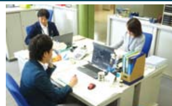
専門相談員が対応いたします

センターでは、社会福祉士、精神保健福祉士などによる専門の職員が、困難事例や相談支援専門員の人材育成に取り組む他、障がいをお持ちのご本人やご家族、関係機関などからの福祉サービスの利用、日常生活上の困りごとなど、様々なご相談に応じています。