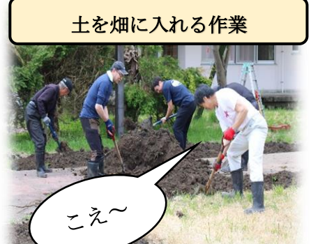
土を畑に入れる作業