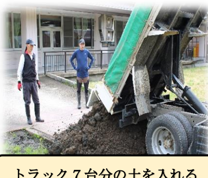
トラック7台分の土を入れる