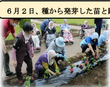
6月2日、種から発芽した苗と購入した苗をみんなで畑に植えました