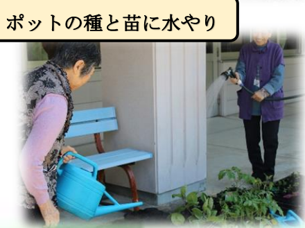
ポットの種と苗に水やり